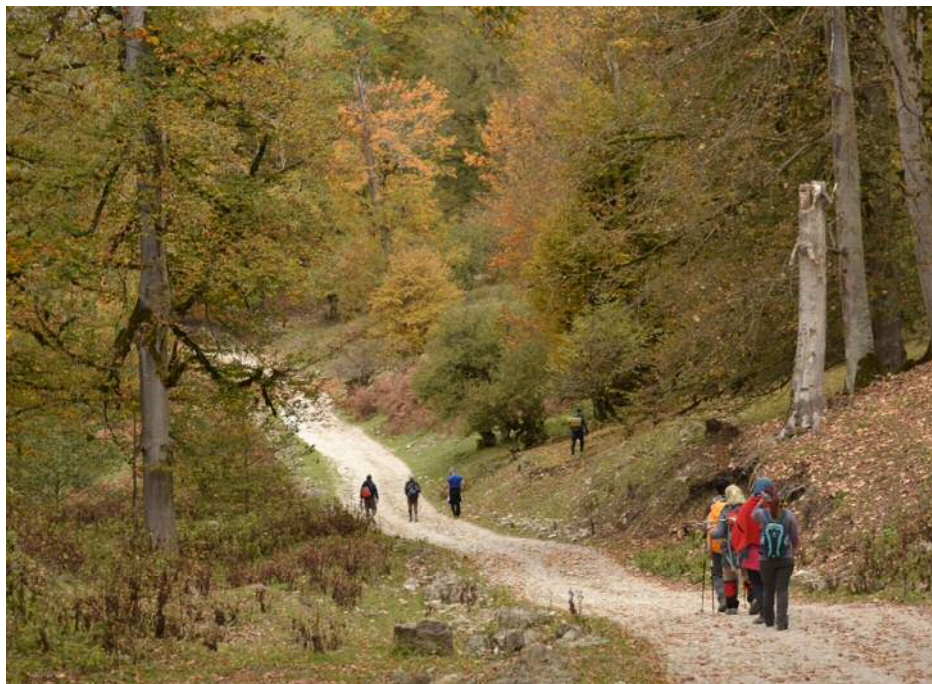
عکس های برنامه: